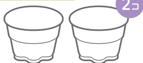
Bigプッチンプリンの 空きカップ