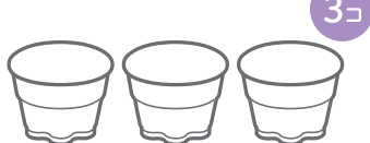
プッチンプリン 3個パックの空きカップ