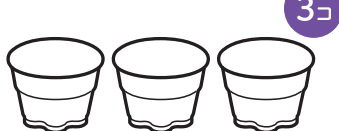
プッチンプリン 3個パックの空きカップ