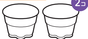
Bigプッチンプリンの 空きカップ