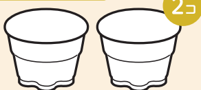
Bigプッチンプリンの 空きカップ