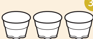
プッチンプリン 3個パックの空きカップ