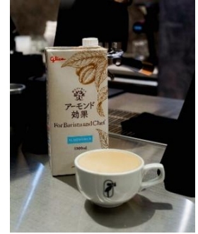
※Philocoffea表参道店、Philocoffea201のみ展開