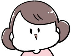
倉田けい デザイン

ご自宅やコンビニ等のプリンターでプリントアウト(A4サイズ推奨)して、 フォトプロップスをはさみで切り抜いて赤ちゃんの写真撮影に使ってね!