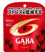
2016年 全品スタンドパウチに