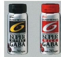
2007年 スーパーミルク・スーパービター