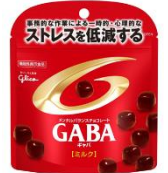
2016年 全品スタンドパウチに