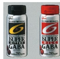
2007年 スーパーミルク・スーパービター