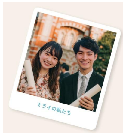
＜「オリジナル未来フィルター」で生成した画像＞