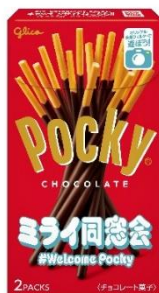
＜対象パッケージ例＞