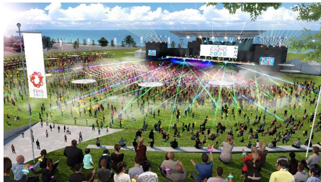
会場イメージ