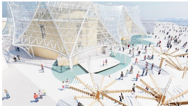
会場イメージ

概要：「タンサ脂肪酸」（21日）、「抗酸化」（22日～24日）をテーマにイベントを開催