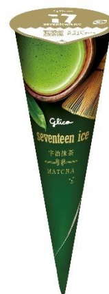
セブンティーンアイス 宇治抹茶