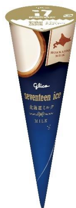
セブンティーンアイス 北海道ミルク