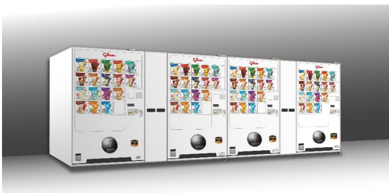
セブンティーンアイス自動販売機