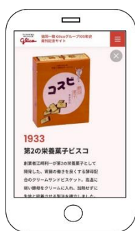
スマホ画面 (イメージ)

2019 年 7 月から 2023 年 12 月の約 4 年半かけて編纂しました。公式ホームページに公開した正史版、ガイド版はパソコン、スマートフォン、タブレットでいつでも、どこでも、どなたでも閲覧できます。スマホやタブレットに対応し、読みやすくしました。