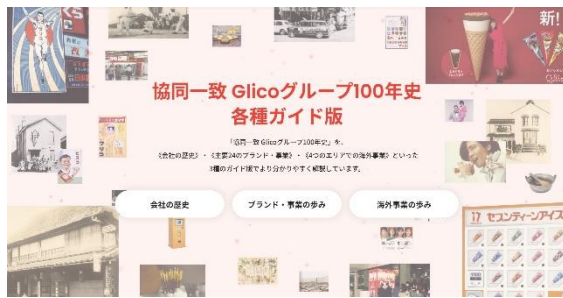
トップ画面（日本語）