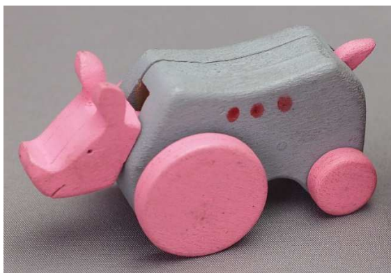
<1988 年 親子で遊べるおもちゃの試作品>