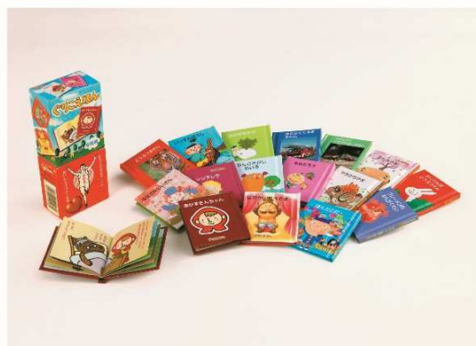
<2005 年 ぐりこえほん >