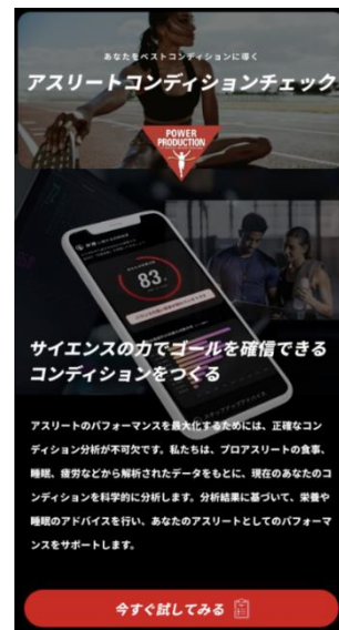
アスリートコンディションチェック

江崎グリコは、スポーツ科学・スポーツ栄養学に基づいて設計された、スポーツフーズブランド「パワープロダクション」を展開しています。休息・運動・栄養のサイクルを効果的に循環することで、アスリートのパフォーマンスを向上する「戦略的リカバリ」を新たな回復の考え方として掲げています。この度、スポーツテック企業「株式会社ユーフォリア」とメンタルヘルスの重要性を啓発する「よわいはつよいプロジェクト」に協力いただき、アスリートのパフォーマンスを向上させるために重要なコンディション分析を行えるウェブアプリ「アスリートコンディションチェック」をリリースします。コンディションの最適化は勝敗を左右すると考え、自分のコンディションと向き合い戦略的に休息・運動・栄養をとることの重要性を啓発し、ビギナーからトップアスリートまですべてのアスリートのパフォーマンスアップを支援します。