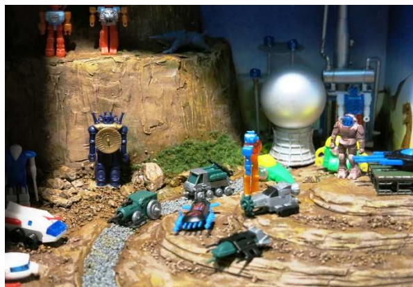
<おもちゃを使ったジオラマ>