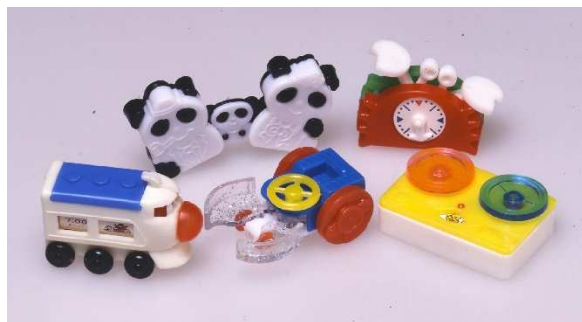
<1970 年代 大きくカラフルなおもちゃ>