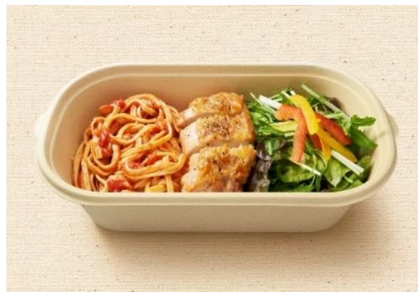
アラビアータとチキンステーキ