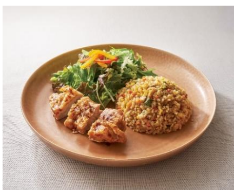
チャーハンとチキンの照り焼き風