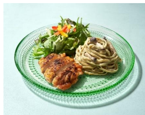
バジルクリームパスタとチキンの山椒焼き