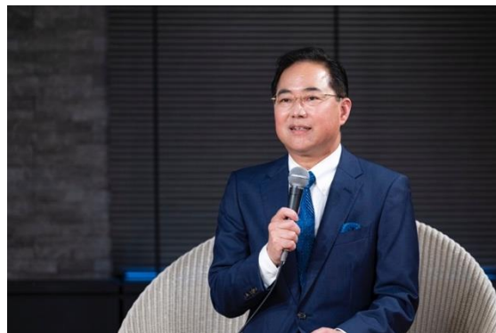
慶應義塾大学医学部教授 井上 浩義氏