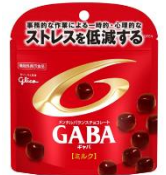
2016年 全品スタンドパウチに