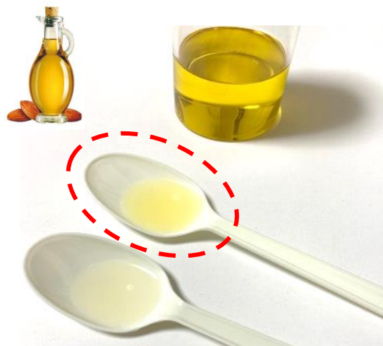
上：アーモンドピークに配合しているアーモンドオイル 下：市販のアーモンドオイル

アーモンドの素材が持つ健康価値に着目し、アーモンドを包むチョコレートにアーモンドオイルを新配合しました。アーモンドオイルは、オレイン酸を多く含み、香ばしい風味が特徴のナッツオイルとして古代より美容や健康の目的で使われています。アーモンドピークに新たに配合したアーモンドオイルには、厳選して買い付けた、味わいが濃い品種を使用。さらに、少量ずつ手間をかけて搾っているため、色・風味ともに通常のアーモンドオイルよりも濃く、香り高いことが特徴です。