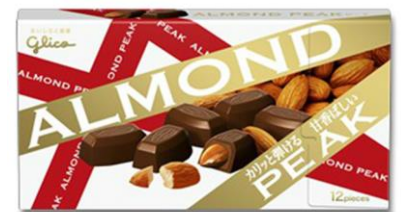
2011年発売 「アーモンドピーク」