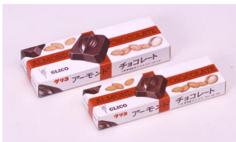
1958年発売 「アーモンドチョコレート」

長い歴史と伝統を現代に受け継いだ「アーモンドピーク」。本リニューアルで、アーモンドのおいしさに加え、健康価値をさらに引き出したカラダに嬉しい新アーモンドチョコレートとして生まれ変わります。