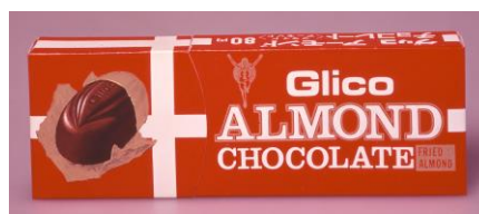
1969年発売 「アーモンドチョコレート<フライド>」