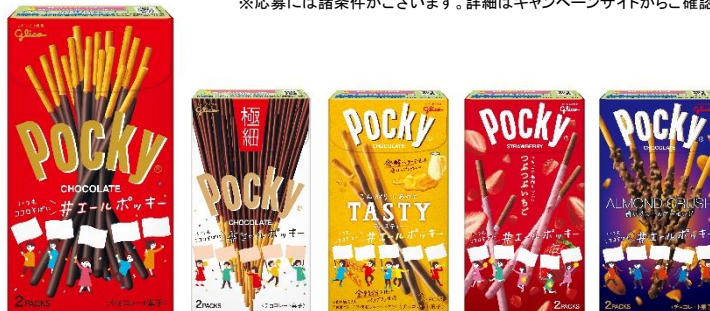
5文字のエールが書ける限定デザインのパッケージ