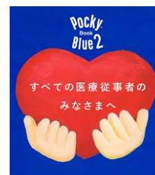
Pocky Book Blue イメージ

中でもひっ迫する医療現場の最前線で日々奮闘してくださっている医療従事者のみなさまに、少しでも穏やかな気持ちになる時間をお届けしたいという思いから、たくさんの方からの感謝と応援の気持ちを「Pocky Book Blue」というひとつのデジタルブックにまとめてお届けする活動を、昨年秋に続き、今年も実施します。キャンペーンサイトから、医療従事者の方々への感謝や敬意、応援のメッセージを集め、一部のコロナ重症センターには募ったメッセージと「ポッキー」を直接お届けするほか、キャンペーンサイトでの掲載に加え、ポッキー公式 Twitter や、勤労感謝の日にグリコビジョン渋谷にも掲載する予定です。