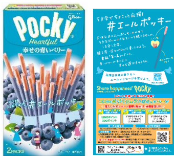
ポッキーハートフル＜幸せの青いベリー＞