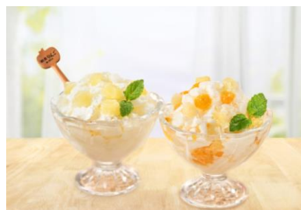
“朝しゃりヨーグルト”のイメージ