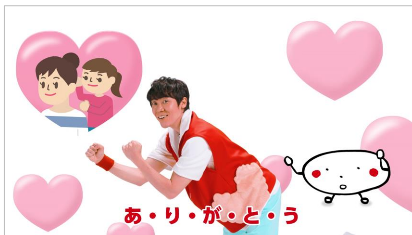
「ちょうたいそう」動画第2弾

「ちょうたいそう」は、元体操のお兄さんである小林よしひささんが監修した、おなかまわりを元気に動かす体操です。お家の中で、小さいお子様が簡単にチャレンジできるように考えられています。「ちょうたいそう」動画の第1弾は2月23日(火)より公開中で、ゾウさんやペンギンさんの動きを取り入れた体操となっています。そして今回の第2弾では、「ちょうありがとうたいそう」にパワーアップ！“ありがとう”を伝える動きを取り入れた、母の日にぴったりの体操です。