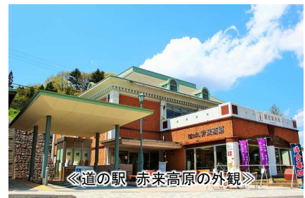
《道の駅 赤来高原の外観》

「道の駅」は、自治体と道路管理者が連携して運営する道路施設で、国土交通省によると昨年7月時点で全国1,180カ所が登録されています。道路利用者に休憩や情報を提供する場としてスタートした「道の駅」は、特産物や観光資源を生かした地域拠点へと発展を遂げ、今では、旅行者だけでなく地元の人にとってなくてはならない存在にまでなっています。その「道の駅」に関し、国土交通省では、2020年から2025年までを“次のステージ”と位置づけ、強化すべき項目の一つとして「防災機能」と「子育て支援」を掲げています。“防災”は広域的な防災機能を担うためハードとソフトの両面を強化し、一方の“子育て支援”は子育て応援施設(ベビーコーナーなど)の拡充を図ることなどが計画されています。そんな中、島根県飯南町の「道の駅 赤来高原」では、それらを同時に実行する取り組みを次々と始動させています。