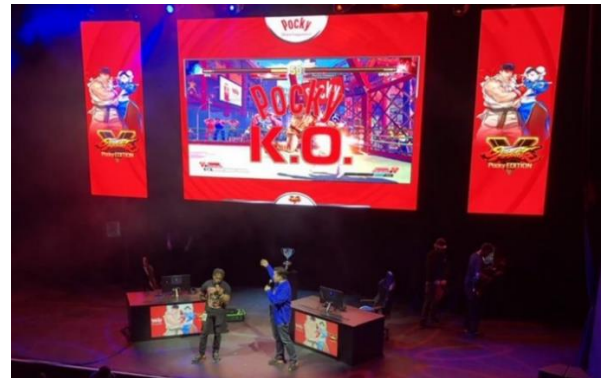
＜昨年実施した、Capcom Cup2019 内 Pocky K.O. exhibition match の様子＞

当社は、e スポーツが競技者のみならず、周囲やオンラインで観戦している観客にもワクワクや感動をもたらし、関わる方々の心の健康に寄与するものだと考えています。そして、世界有数のゲームであるストリートファイターV との今回の協業により、Pocky が人々の幸せに貢献できることを願っています。また、本取り組みを通じて、全世界の両ブランドのファンに、Pocky のブランドメッセージである“Share happiness!” を広げ、e スポーツコミュニティのさらなる活性化を目指します。