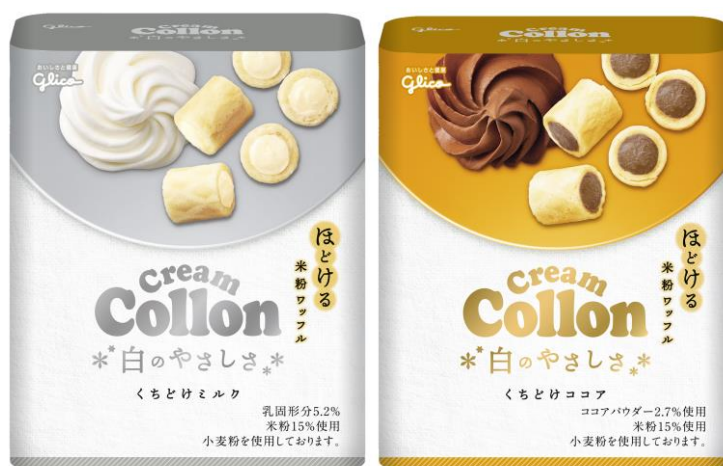
左から<くちどけミルク>、<くちどけココア>

「クリームコロ」ブランドは、今後も様々な取り組みを通して、全てのお客様に「ほっと安らぐ瞬間」を提供できるように提案を行ってまいります。