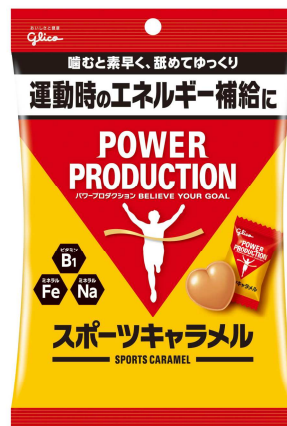
画像：パワープロダクション新商品＜スポーツキャラメル＞

江崎グリコ創業の商品、栄養菓子「グリコ」は子供の栄養が十分でなかった時代に栄養素グリコーゲンと、当時子供たちに人気があったキャラメルに入れて、体位向上に貢献したいという創業者の想いから生まれました。この想いは企業理念「おいしさと健康」として受け継がれ、さまざまな商品やサービスへとその領域を広げております。本商品もお客様の健康に寄り添うべく、時代に合わせた運動時のエネルギー補給として、キャラメルの新しい価値を提案しております。当社はこれからも総合食品メーカーとして、「おいしさと健康」の企業理念の下、新たな健康価値を提案・提供して参ります。