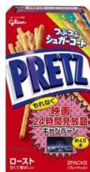
プリッツ ＜ロースト＞ 62g