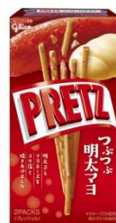
プリッツ ＜明太マヨ＞ 55g