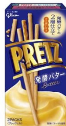
プリッツ ＜発酵バター＞ 60g