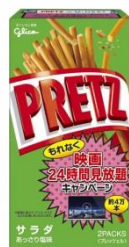
プリッツ ＜サラダ＞ 69g