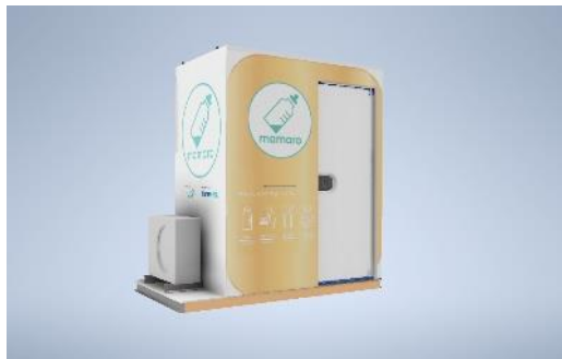
設置型ベビーケアルーム「屋外用mamaro(仮称)」※イメージ