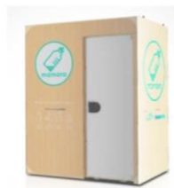
▲屋外用ベビーケアアルーム mamaro イメージ