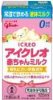
アイクレオ 赤ちゃんミルク

※第42回横浜開港祭での「アイクレオ 赤ちゃんミルク」のご提供は、各日先着300名様とさせていただきます。