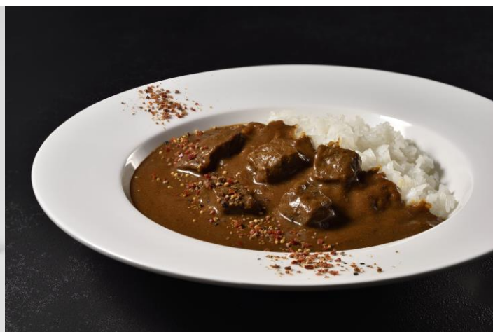
盛り付けイメージ