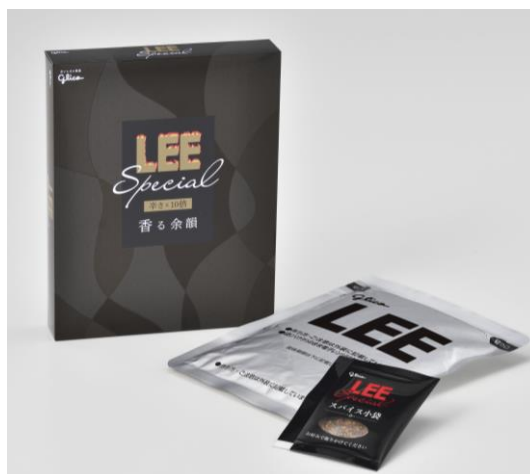
LEE スペシャル香る余韻<辛さ×10倍>

※「LEE」の辛さ倍率表示は、カレーソースに含まれる唐辛子と胡椒等の辛味成分の総量により設定。発売当時は、「LEE 辛さ×1倍」が存在しており、その辛さ×1倍のカレーソースに含まれていた唐辛子と胡椒等の辛味成分の総量を基準に、辛さ×5倍なら5倍量相当を配合するなど、辛さ×1倍がなくなった現在でも同じ設定を使用しています。