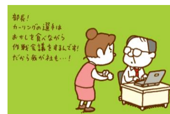
<ヨシタケシンスケ氏によるイラスト>

なお、オフィスグリコの売り場においても、ヨシタケシンスケ氏とコラボしたデザインを11月中旬より順次展開しています。売り場は、調査で見えてきたオフィスワーカーが仕事と仕事の合間にお菓子を活用しているシーンが、カーリング競技におけるインターバルタイム(体と頭へのエネルギー補給であり、次の戦術の確認や集中力を高める時間)に似ているとの発想から、長野県カーリング協会ともコラボしたデザインとなっています。