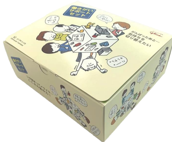
<働きがいサポートセット(菓子詰め合わせ)>

オフィスグリコでは2018年10月～12月にかけて、オフィスグリコ設置企業のオフィスワーカーにどんな時にお菓子を活用しているのか、オフィスビジット調査※を行いました。その結果、多くのオフィスワーカーが「仕事を頑張った後、気持ちを切り替えたい」時、「仕事に行き詰まってイライラしていて、集中したい」時などに菓子を活用していることが分かりました。そんなオフィスワーカーがもうひと頑張りするため、意欲的に仕事に取り組むときにぴったりな人気のお菓子5品を詰め合わせた「働きがいサポートセット」を発売します。