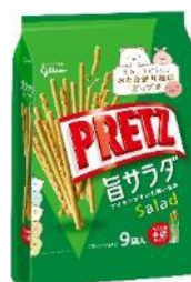
プリッツ旨サラダ〈9袋〉 内容量 143g