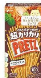
超カリカリプリッツ 〈クリスピーチキン味〉 内容量 55g