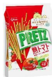
プリッツ熟トマト〈9袋〉 内容量 134g