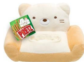
プリッツオリジナル すみっコぐらしぬいぐるみマルチスタンド ※画像はイメージです。