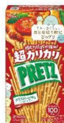
超カリカリプリッツ 〈クリスピーピザ味〉 内容量 55g