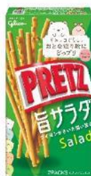
プリッツ 〈旨サラダ〉 内容量 69g