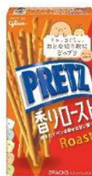
プリッツ 〈香りロースト〉 内容量 62g