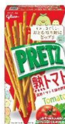
プリッツ 〈熟トマト〉 内容量 60g