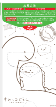
プリッツ<旨サラダ>塗り絵3種類