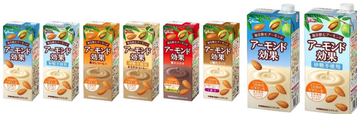
画像：今回リニューアルする「アーモンド効果」シリーズ全8品