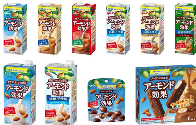
画像：今回リニューアルした「アーモンド効果」シリーズ10品

当社は、1955年から“1粒で2度おいしい”「アーモンドグリコ」を発売するなど、アーモンドのパイオニアです。今後も、アーモンドの栄養を日常的においしく摂ることができる「アーモンド効果」シリーズを通じ、日々の健やかな暮らしをサポートして参ります。