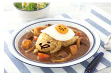
<レシピ名「華麗なるぐでたま」>

(対象製品) プレミアム熟(カレー、ハヤシ)、ドライカレーの素、チキンライスの素、ガーリックライスの素、ごちうまごはんによくあうシリーズ(五目かに玉の素、玉子のすき煮の素、麻婆玉子の素) クレアおばさんシリーズ(クリームシチュー、ハッシュドビーフ)