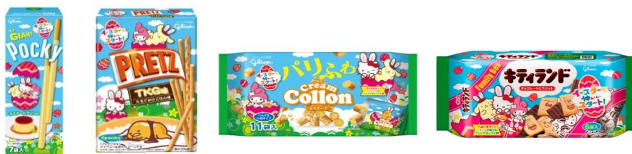
<イースター限定製品>