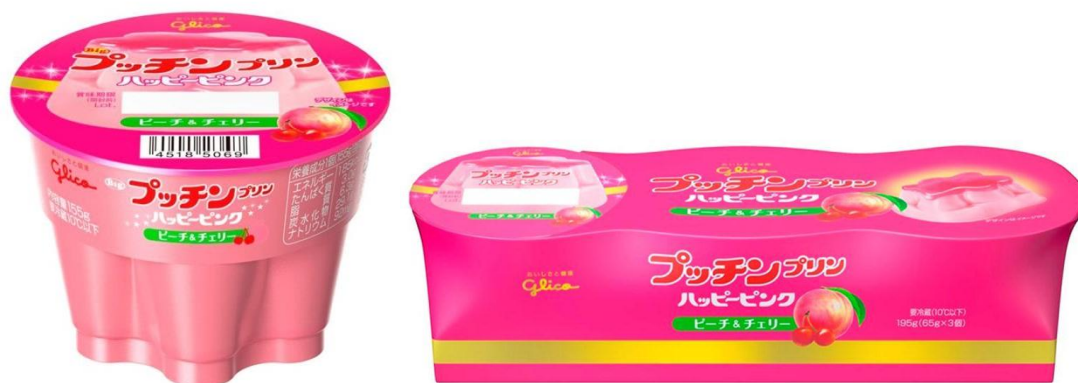
左から「Big プッチンプリン<ハッピーピンク>」、「プッチンプリン<ハッピーピンク> 3個パック」

当社は、1972年発売の『プッチンプリン』において、これからも付加価値の高い製品を開発し、チャレンジを続けてまいります。