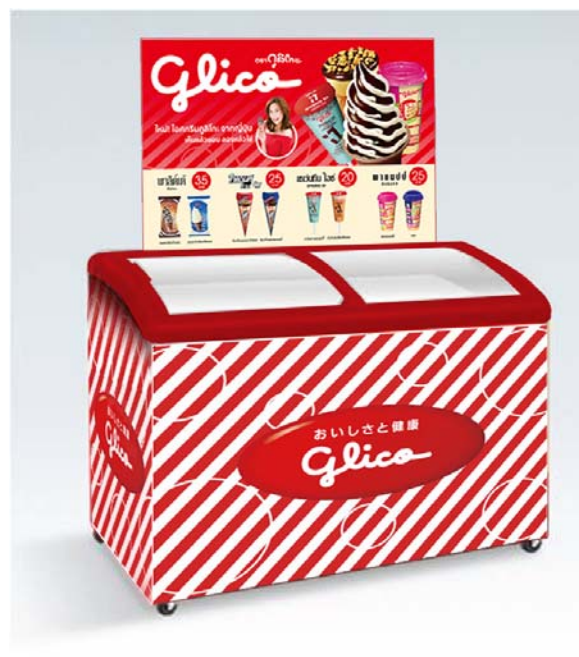
画像：(左) タイでの販促ポスター、(右) 小売店で使用するアイスショーケース