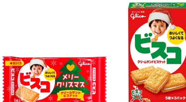
画像(左)「ビスコミニパック」クリスマス限定パッケージ、(右)「ビスコ」クリスマス限定パッケージ