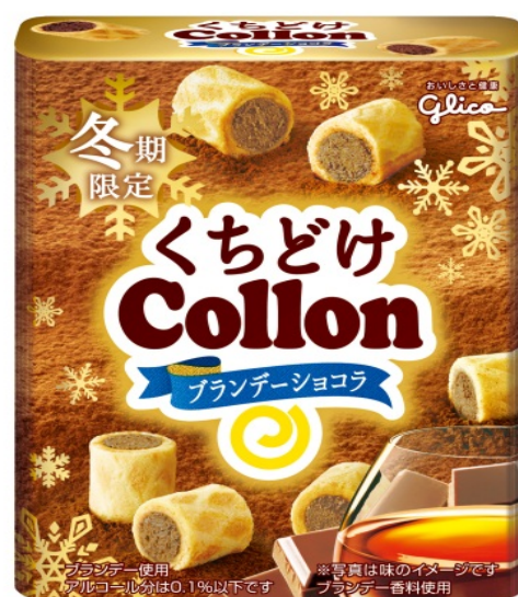
画像：（左から）「くちどけコロン」<ラムバナラ>、<ブランデーショコラ>