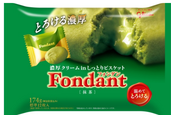
画像：左から『フォンダン<チョコレート>』『フォンダン<抹茶>』