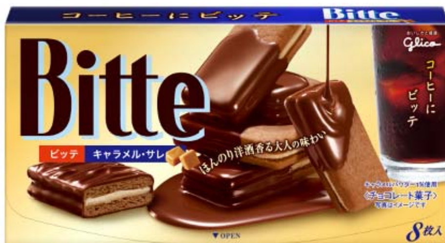
画像：「ビッテ<キャラメル・サレ>」

江崎グリコは、チョコレートとビスケットのおいしさを併せ持つ「ビッテ」において、継続して新製品を提案することにより、市場の活性化を図って参ります。