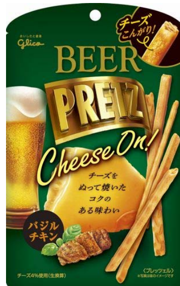
画像左から「ビアプリッツ」＜ベーコンポテト＞、＜バジルチキン＞