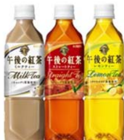
ストレートティー