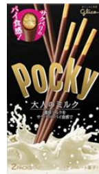
1966年発売当時の画像