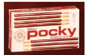
ポッキーチョコレート