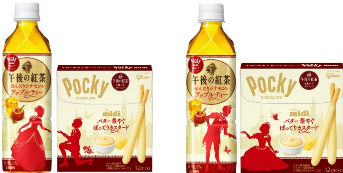
『キリン 午後の紅茶 ほんのりシナモンのアップルティー』、『ポッキーミディ<バター華やぐぼってりカスタード>』 ※「午後の紅茶」は表と裏でそれぞれ姫と王子のデザイン。「ポッキーミディ」はデザインが2種類。

いつの時代にも新しい価値を提供し、お客様の側にいつもある菓子として驚きや楽しさを感じていただけるよう様々な食シーンをご提案し、これからも食品市場の活性化に寄与してまいります。