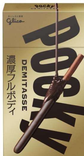
画像：『ポッキー<デミタス>』

江崎グリコの「ポッキー」は、ライフスタイルにおける様々なシーンやニーズに寄り添う商品をご提案し、チョコレート市場の活性化に寄与してまいります。