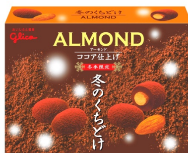
画像：左から『冬のくちどけポッキー』、『冬のくちどけアーモンド<ココア仕上げ>』