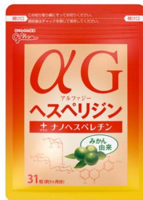
画像：「α Gヘスペリジン+ナノヘスペレチン」

※「ヘスペリジン」(ビタミンP)は、温州みかんなどの柑橘類に含まれるポリフェノールの一種であり、健康維持に役立つ成分として古くから知られています。