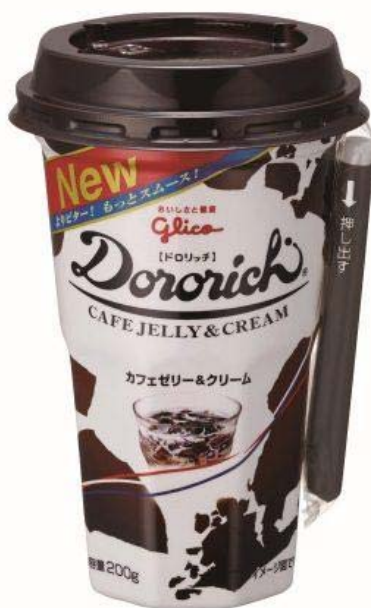
『ドロリッチ<カフェゼリー&クリーム>』

『ドロリッチ<カフェゼリー&クリーム>』は小腹を満たしたいとき、気分をリフレッシュしたいときに相応しい、コクと香りを味わうコーヒーデザートドリンクとして、これからも進化を続けます。