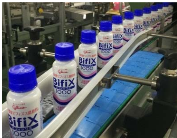
『高濃度ビフィズス菌飲料BifiX1000 100g』と生産ライン