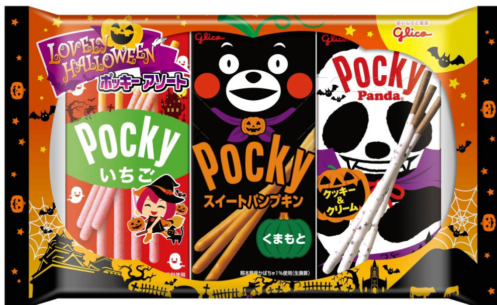
ラブリーハロウィーンポッキーアソート

江崎グリコは、『ポッキー』シリーズからハロウィンキャンペーン品を発売することで、選ぶ楽しさを提供し、ハロウィン菓子市場の活性化に寄与してまいります。