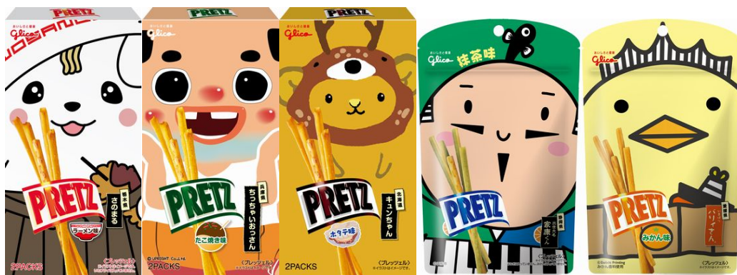
写真：「ご当地キャラクタープリッツ」

江崎グリコは、スティックスナックのロングセラーブランド「プリッツ」を、ターゲットに合わせた企画や味づくりで食シーンの拡大を図り、市場の活性化に寄与して参ります。