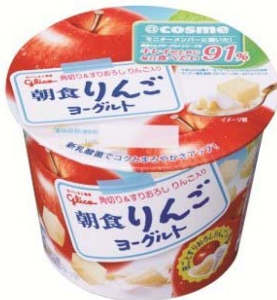
『朝食りんごヨーグルト 145g』