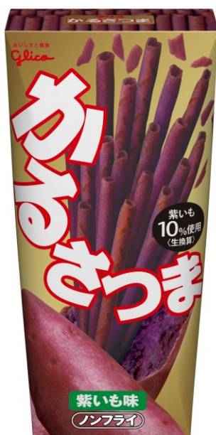
かるさつま<紫いも味>

江崎グリコは、『かるさつま<紫いも味>』を発売することで、紫いもを使ったスナックならではの女性に人気という特性を活かし、新たに女性の顧客を獲得し、かるじゃがブランドを拡大させます。