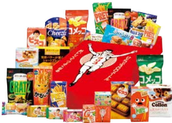
※商品写真はイメージ

株主の皆さまの日頃のご支援に深く感謝するとともに、Glicoグループに対するご理解を深めていただくために、株主優待制度を実施しています。2018年度は、100株以上ご所有の株主の皆さまにGlicoグループ商品の詰合せを贈呈しました。