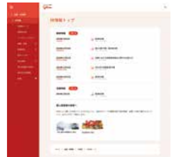
ウェブサイト「IR情報」トップページ

また英文で決算短信、決算説明会資料、アニュアルレポート等を掲載し、外国人投資家の皆さまへの情報発信も積極的に行っています。さらに事業内容や品質への取り組みをわかりやすく紹介するウェブサイトを設け、Glicoグループの事業姿勢や活動をご理解いただけるウェブサイトづくりに取り組んでいます。