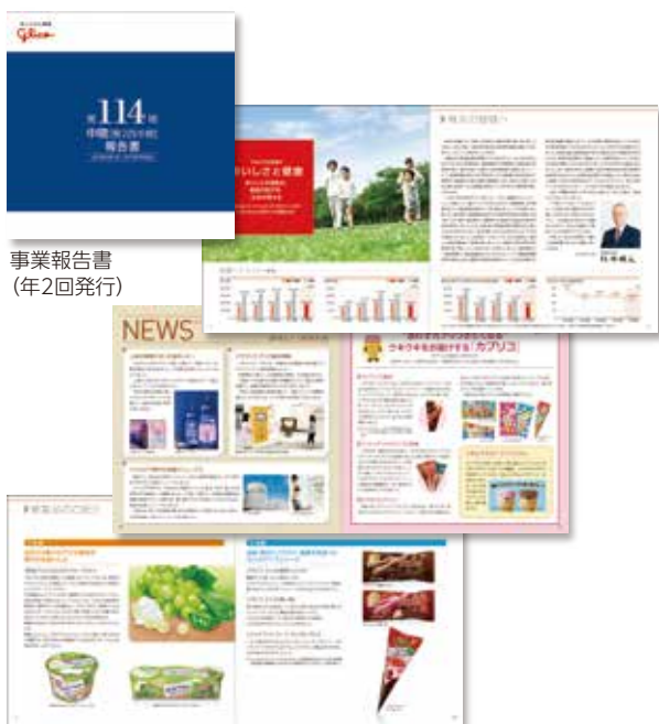
事業報告書 (年2回発行)

その他、年2回、事業報告書を発行し、Glicoグループの事業について報告しています。