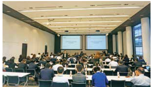
決算説明会(年2回開催)

機関投資家の皆さまに対して毎年5月と11月の年2回、決算説明会を開催し、経営トップが決算内容や経営方針、経営戦略について説明しています。また証券会社が主催するコンファレンスミーティングへも積極的に参加している他、スモールミーティングや施設見学会、個別取材にも随時対応し、機関投資家の皆さまと活発なコミュニケーションを図っています。