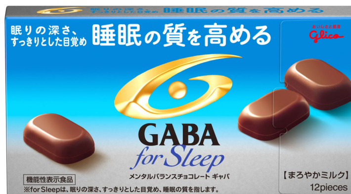
メンタルバランスチョコレート GABA フォースリープ<まろやかミルク>